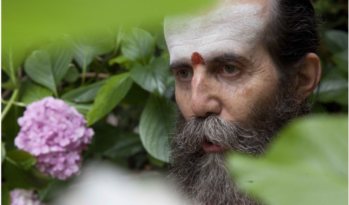
Fotografía de Sebastián Romero Márquez.

hinduismo. “Los editores de la revista Hinduism Today , hindúes occidentales, exponen que existen un mínimo de prácticas, creencias y actitudes que casi siempre son comunes a la mayoría de hindúes” Según la Cosmovisión hindú, la totalidad de la vida es un aprendizaje y una disciplina. En el transcurso de este aprendizaje, el ser humano pasa por cuatro etapas o estadios denominados ashramas... “El hinduismo y toda la tradición oriental no trata de acumular conocimientos, que eso nos ayuda muy poco, sino de transformarlos” Junto con este libro, se ha creado una página para los interesados... advaitavidya.org . Y al finalizar la lectura del mismo podemos ver aquellos libros que con un breve comentario nos recomienda el autor. “Introducirse desde lejos, pero acercarse a lo más